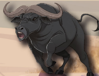
АФРИКАНСЬКИЙ БУЙВІЛ AFRICAN BUFFALO